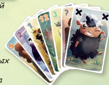
5 карточек обычных животных +1 Чёрная овечка +1 особое животное