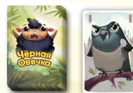
Сопка животных Сорока-воровка