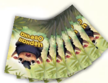
Подготовка к игре для трёх игроков