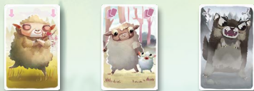
Белая овечка Овечка-мама Волк