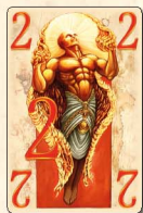
Огонь (2 очка) — 2 шт.