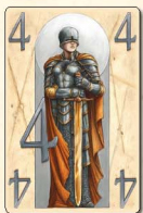
Металл (4 очка) — 2 шт.