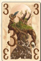
Земля (3 очка) — 2 шт.