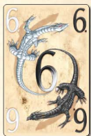
Инь и Ян (6 очков) — 6 шт.