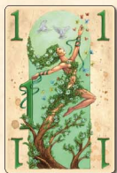
Дерево (1 очко) — 2 шт.