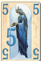
Вода (5 очков) — 2 шт.